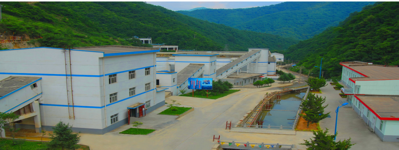
绿色环保的企业生产矿区

进度，询问工程质量，针对困扰各企业的诸多问题，积极与省、市、县及设计部门协商交流，赢得了各级政府的大力支持和帮助，有力地推动了陕甘区域企业建设。