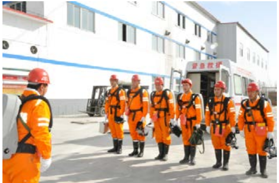
中国黄金集团内蒙古包头鑫达公司应急演练

针对施工队事故多发的问题，中国黄金制定了《矿山生产企业井下采掘工程招投标补充规定》，提高了施工队伍准入门槛；改变以往“甲方乙方”的思想，倡导