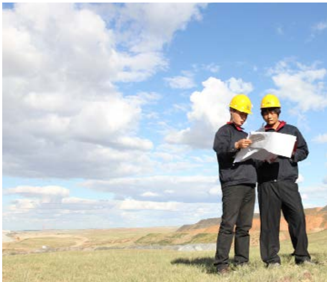
中国黄金集团苏尼特金矿公司进行地质探矿