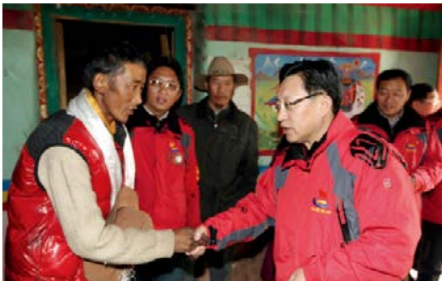
中国黄金集团公司总经理、党委书记宋鑫慰问中国黄金集团西藏华泰龙公司所在地西藏甲玛乡贫困户。

中国黄金集团公司是黄金行业唯一一家中央企业，肩负着保障人民币国际化、抵御金融风险、维护国家金融安全等重要职责。目前，黄金资源储量、矿产金产量、精炼金产量、黄金投资产品市场占有率、黄金选冶技术水平、上海黄金交易所综合类会员黄金实物交易量六项指标行业第一。教育实践活动开展以来，我们把群众路线作为一种理念融入管理，作为一种动力融入发展，作为一种精神融入中央企业“153”战略，坚持两手抓、两不误、两促进，努力将中央企业的政治优势