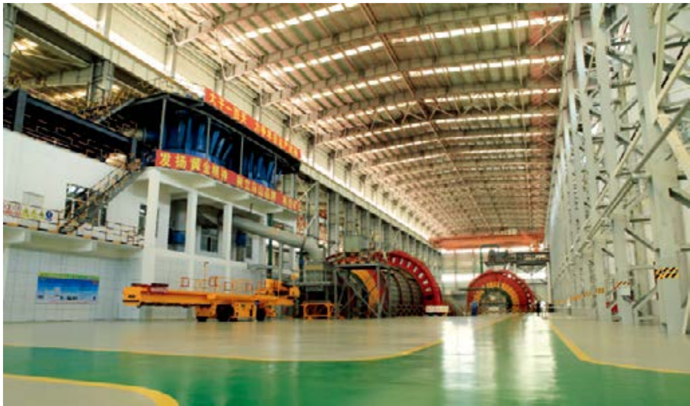
中国黄金内蒙古矿业公司拥有国内最大磨机的乌山生产现场。

融入安全环保。安全生产事关职工群众的生命安全，直接关系到职工群众切身利益。集团公司党委要求，领导班子成员下基层抓教育实践活动与抓安全环保工作相结合，下基层必查安全，必提安全要求，把教育实践活动转化为安全发展、珍视生命的自觉行动。严守安全“红线”，强化安全“三基”（基础、基层、基本功），严问安全责任。在狠抓“三基”工作中，抓基础，重点推进安全标准化建