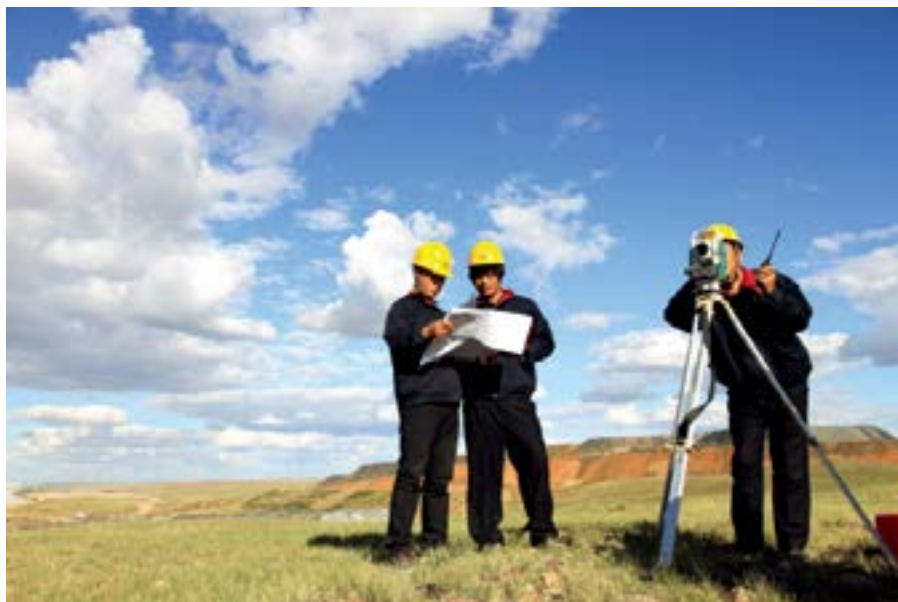
中国黄金集团苏尼特金矿公司员工进行地质探矿。

波动的严峻市场挑战，在教育实践活动中，我们借鉴国际一流矿业公司及东方希望集团等优秀民营企业独特的管理经验和做法，针对行业特点，找准短板，开展全方位对标，切实提高集团公司发展质量和效益。2013年，在黄金年均价下滑30%、铜价大幅波动的情况下，全年实现销售收入1101亿元，同比增长9.5%；生产矿产金39.4吨，超额完成年预算的10%，矿山铜10.2万吨，超额完成年预算的8%，矿产金和矿山铜产量分别位居国内第一和第四位。今年上半年，集团公司实现营业收入完成年预算的50.33%；利润总额按预算口径完成年预算的50.27%；生产矿产金完成年预算的50.05%，矿山铜完成年预算的49.4%。在主要产品价格持续低迷的市场条件下，主要指标均实现“时间过半、任务过半”的目标。