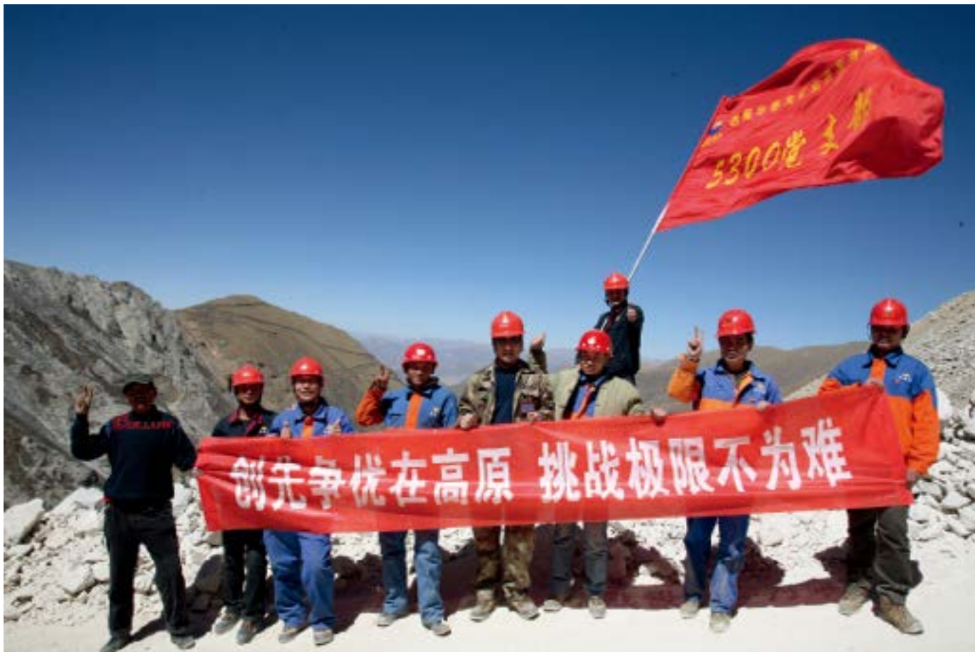
挑战高原极限，铸就金色堡垒。